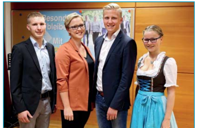
Unsere Jüngsten, die sich auch einiges vorgenommen haben und planen