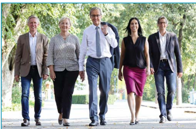
Das „Strategie- Team“, das einen sehr aktiven Sommer und Herbst hinter sich hat