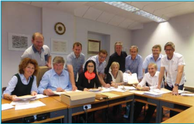
1033 Fragebögen ausgewertet..

So eine aufwändige Meinungsumfrage erfordert schon viele Helferinnen und Helfer, und die hatten wir!