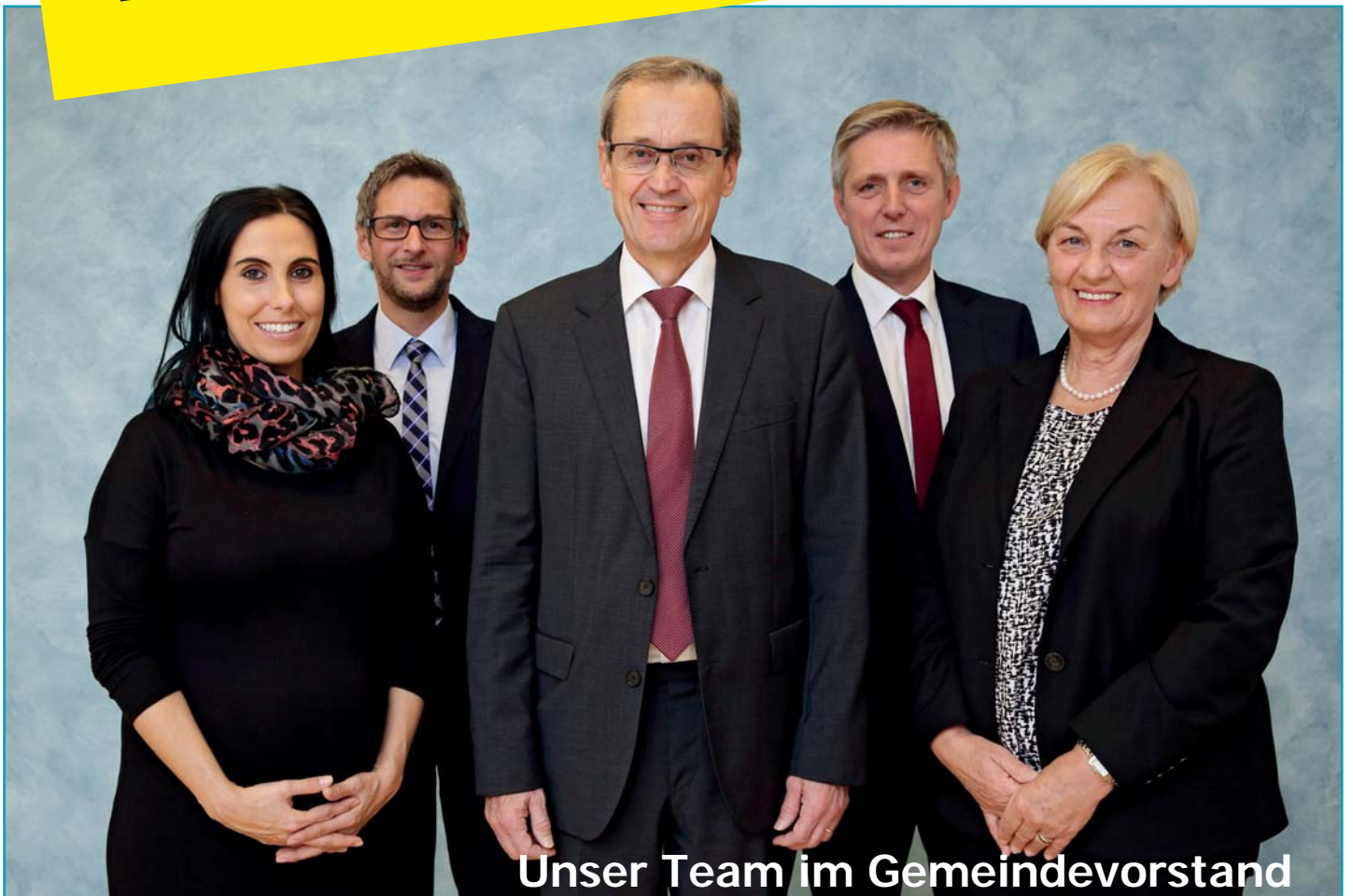
Unser Team im Gemeindevorstand