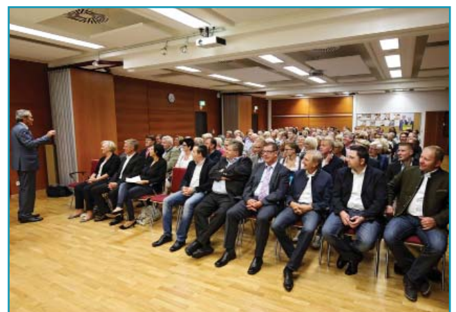
Und alle Anderen, die sich gerne um Sie bemühen werden.