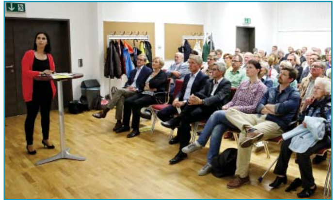
.. und die Ergebnisse präsentiert

Das schönste Ergebnis war insgesamt, dass fast 90 % der Befragten überzeugt sind, dass sich Bad Schallerbach in den letzten 5-10 Jahren besser entwickelt hat als andere Gemeinden. Und dass 80 % die Lebensqualität bei uns für besser halten als in anderen Gemeinden!