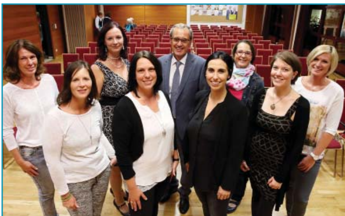
Unser ÖVP Frauen- Team, das mittlerweile schon mit guten Aktionen gestartet ist

Darauf konnten wir gut aufbauen und fanden für die weitere Gemeindegarbeit ein Team, das sich bereit erklärte, auf diesem Niveau weiter zu arbeiten. Dieses Team und ein Programm für Bad Schallerbach präsentierten wir dann bei unserem Wahlauftakt am 9. September.