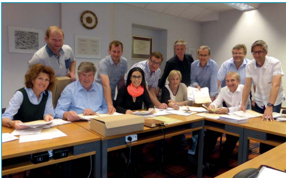
Gemeinsam wurde gezählt und aufgeteilt- mit Freude, wie man sehen kann

Das Ergebnis werden wir am Montag, 22. Juni 2015, um 19.30 h im Atrium öffentlich präsentieren. ( Siehe auch letzte Seite)