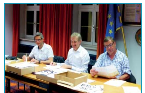
Hoch konzentriert wurde hier gemeinsam gearbeitet!

Wir bedanken uns noch einmal bei allen, die uns ihre Meinung mitgeteilt haben. Wir werden diese Auswertungen sehr ernst nehmen. Danke auch an alle unsere Team-Mitglieder, die eingesammelt haben!