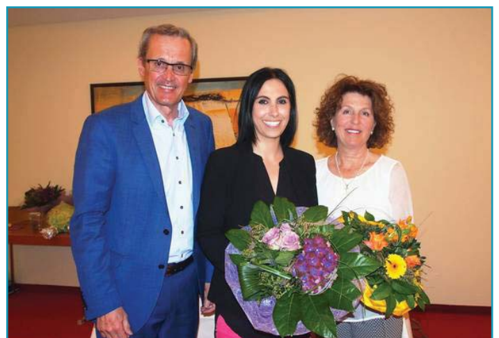
Ein herzlicher Dank der scheidenden Obfrau und alles Gute der neuen Leiterin der ÖVP Frauen von Bad Schallerbach

Auch beim Ferienpass-Programm bringen sich die ÖVP-Frauen mit einer Schatzsuche und dem erfolgreichen Fotomarathon ein.