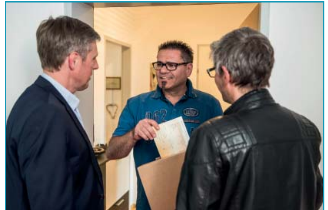
.....und in der Schönauer Straße

Das Ausleeren der Urnen und das Zählen der Rückantworten war schon sehr spannend, denn: 1036 Stück sind zurückgekommen!