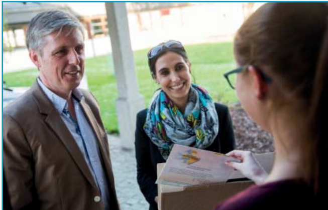
Freundlicher Empfang im Gstocket .....

Erst wurden die Bögen von uns persönlich mit einer Urne eingesammelt oder wir hinterließen ein Rückkuvert, wenn wir jemanden nicht angetroffen haben.